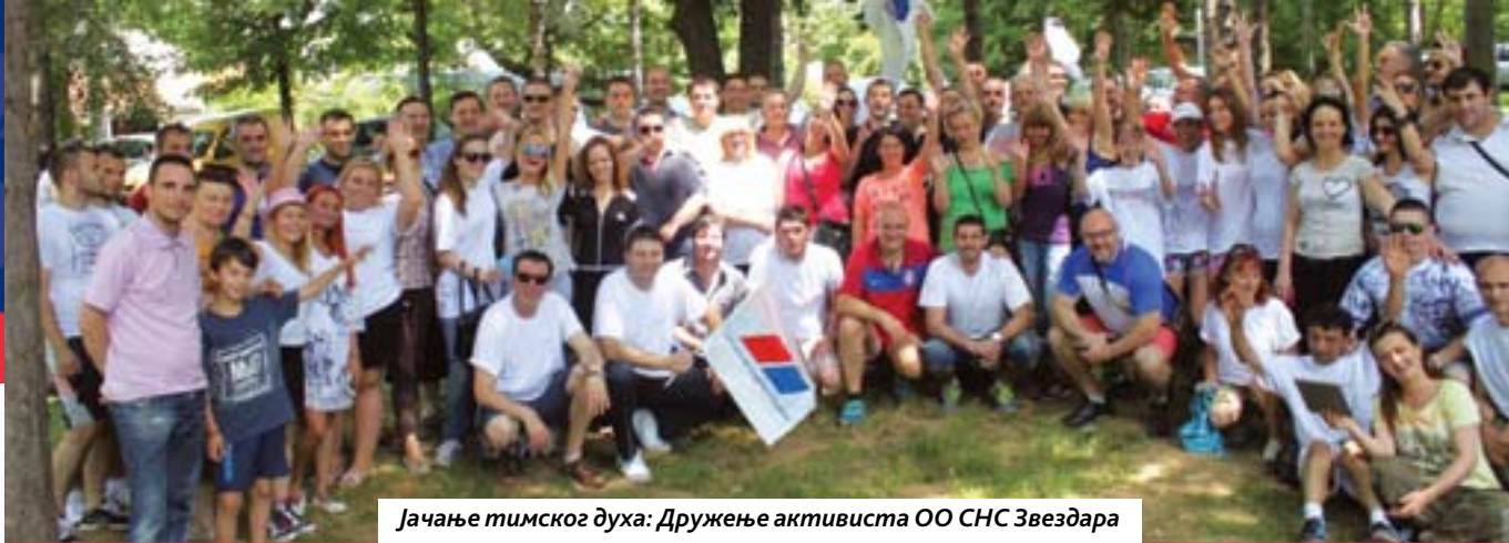
Јачање тимског духа: Дружење активиста ОО СНС Звездара