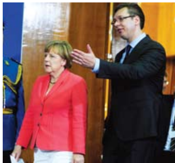
Канцеларка Меркел и премијер Вучић крећу на заједничку конференцију за новинаре

Посета Ангеле Меркел Србији била је тема и регионалне штампе, па тако „Либеркер нахрихтен“ пише о подршци Србији у решењу проблема са избеглицама које пристижу из кризних подручја Сирије и других земаља.