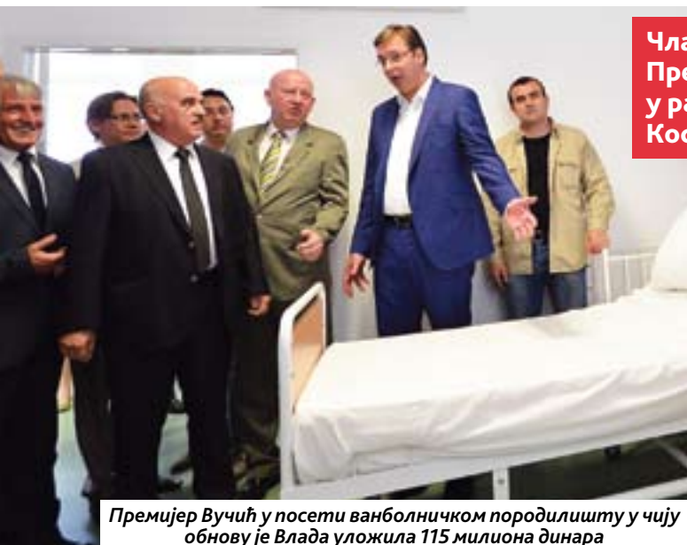
Премијер Вучић у посети ванболничком породилишту у чију обнову је Влада уложила 115 милиона динара