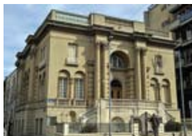
Музеј Николе Тесле