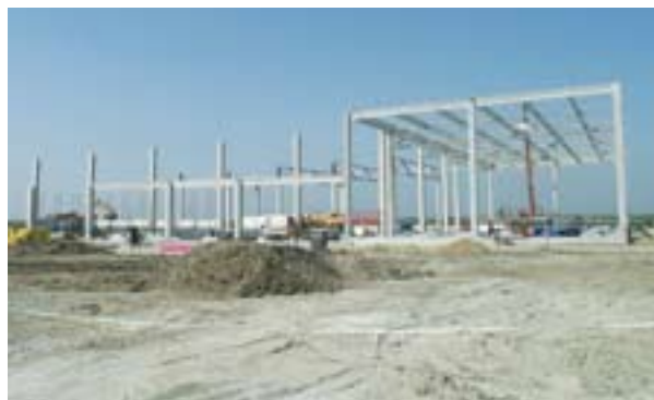
Изградња фабрике „Хачинсон“ која ће производити делове за аутоиндустрију