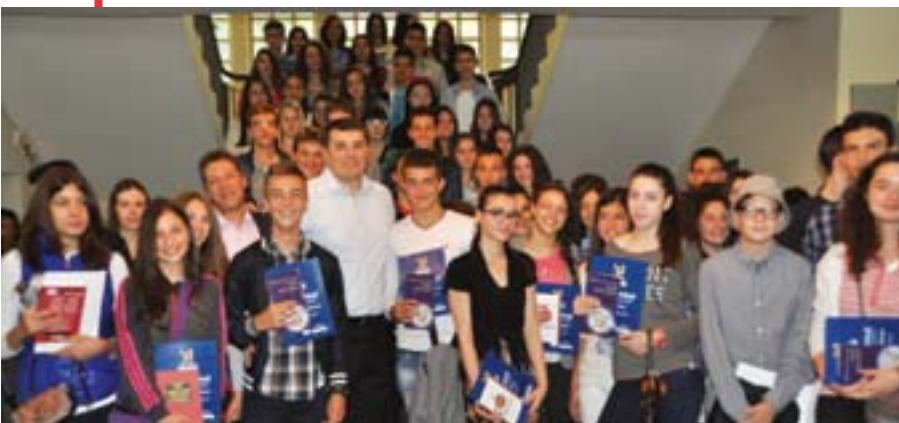
Награђени најбољи ученици

Очишћени су и уређени паркови на Душановцу, код вртића „Бисери“ и у насељу Браће Јерковић. Активисти СНС, уз помоћ Еко патроле Општине Вождовац и ЈКП Зеленило Београд, очистили су зелене површине од смећа, уклонили растиње и покосили траву у Кумодрашкој 376 и Ораховој улици. Савет за избегла и расељена лица и Савет за националне мањине организовали су трибину „Положај избеглих и расељених у Србији“. У просторијама МО Милунка Савић одржано је Саветовалиште за здрав живот, где су грађани могли бесплатно да провере здравствено стање, измере притисак и шећер. Савет за социјална питања организовао је пловидбу Дунавом, као вид дружења са особама са сметњама у развоју из домова и удружења у Београду.