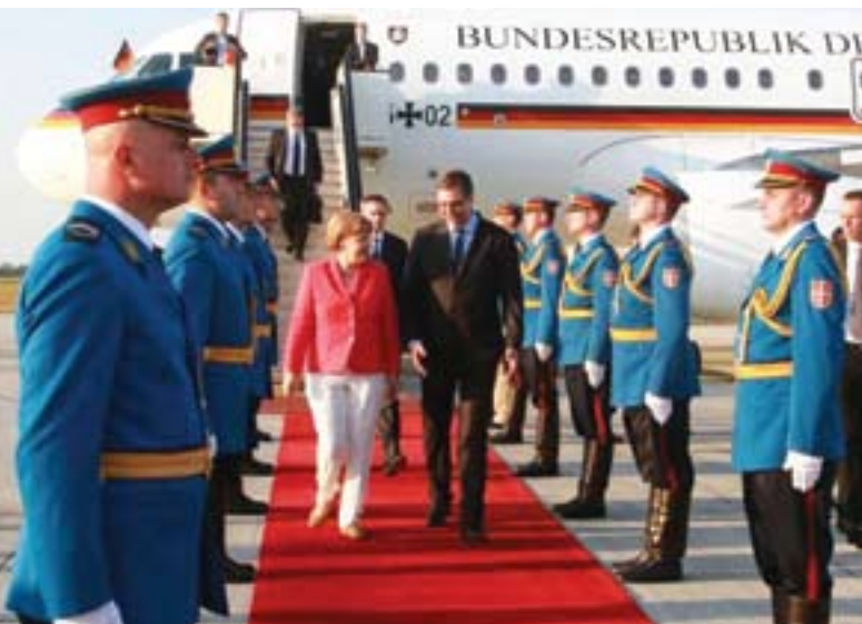
Премијер Вучић дочекује канцеларку Меркел на аеродрому

К анцеларка Савезне Републике Немачке, Ангела Меркел, боравила је у дводневној посети Београду, током које је разговарала са српским премијером, Александром Вучићем, председником Србије, Томиславом Николићем, и представницима невладиног сектора.