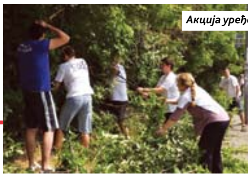
Акција уређења Вождовца