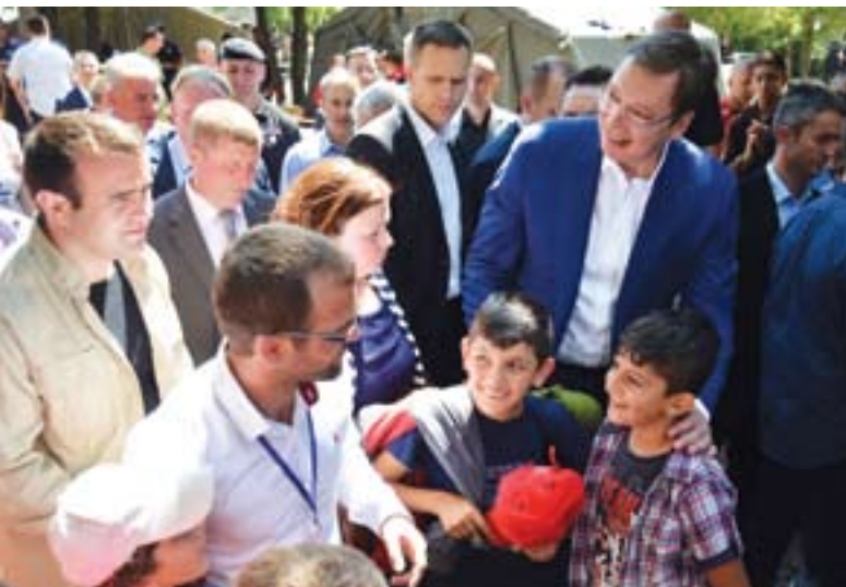
Обилазак Прихватног центра за мигранте

„Мислим да су услови изванредни. Тешко да у неком малом месту у Србији можете да нађете овакве услове, а радићемо још много више да побољшамо живот свих наших грађана на југу Србије“, поручио је премијер.