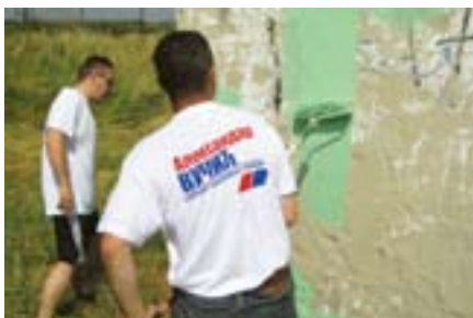
Плаништите - Јерменовци

Чланови ОО СНС Плаништите у МЗ Јерменов-