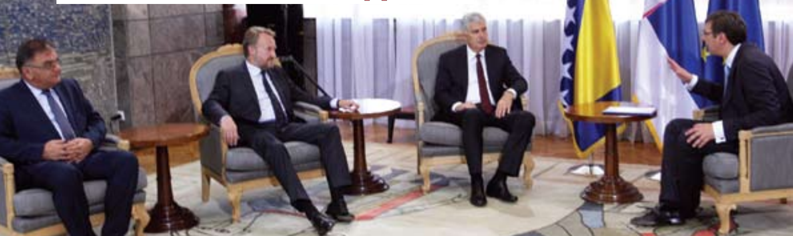
Радни састанак: (слева на десно) Младен Иванић, Бакир Изетбеговић, Драган Човић и Александар Вучић