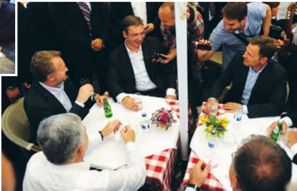
Премијер Вучић са гостима на Калемегдану и у „Коларцу“