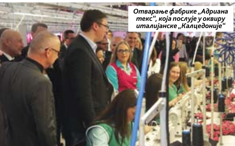
Отварање фабрике „Адриана текс“, која послује у оквиру италијанске „Калцедоније“

Што се тиче великих инвеститора, у последње две године, реализоване су инвестиције британског „Албона“, који треба да запосли 225 радника, отворена је фабрика „Адриана текс“, која послује у оквиру „Калцедоније“ и планира да запосли 600 радника. Фабрика „Еверест“ планира да запосли до крајње фазе 1.200 радника. У току је изградња фабрике „Хачинсон“, која ће се ба-