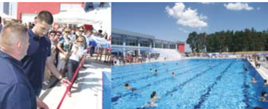
Свечано отварање градског базена у Борковцу

до 50 људи. Реч је о „Новотехни“ и „Карби“, које ће такође допринети смањењу броја незапослених. Након реализације свих ових инвестиција, кроз које се број нових радних места пење ка 4.000, очекујемо да ће незапосленост у Руми бити сведена на ниво од свега седам-осам одсто, колика је у најразвијенијим државама ЕУ, што практично значи да ће радити сви који буду то желели.