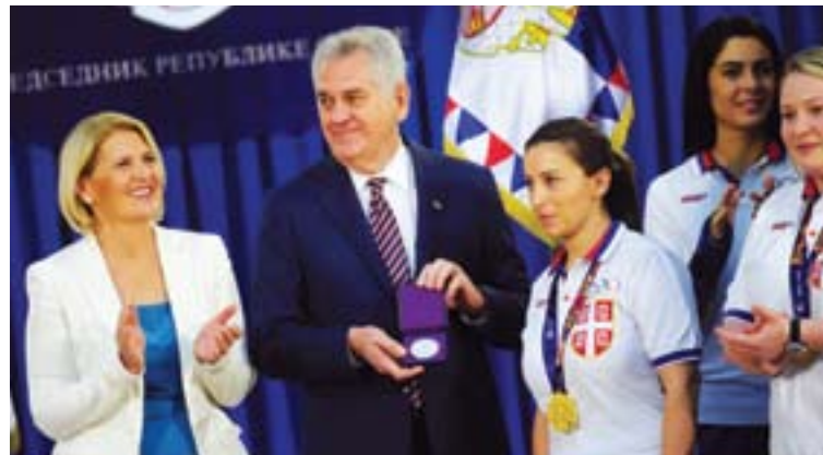
Председник Николић, у друштву супруге Драгице, са освајачима медаља на првим Европским олимпијским играма у Баку