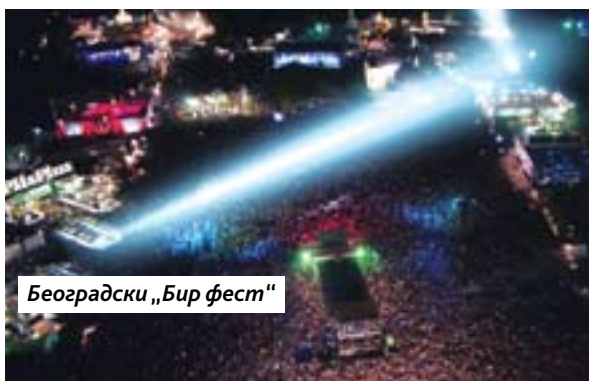
Београдски „Бир фест“