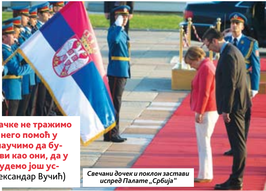
Свечани дочек и поклон застави испред Палате „Србија“

- Ми од Немачке не тражимо милостињу, него помоћ у знању и да научимо да будемо марљиви као они, да у економији будемо још успешнији (Александар Вучић)