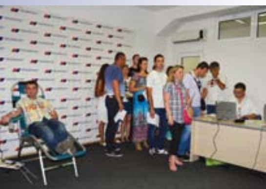
Акција добровољног давања крви у просторијама Градског одбора СНС Београд