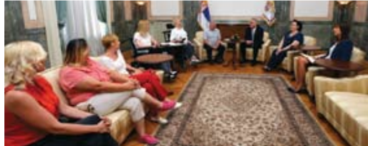
Пријем за делегацију Националне организације особа са инвалидитетом Србије

„Приоритет спољне политике Србије је приближавање Европској унији како би, у оквиру породице европских земаља, могла, не само да поправи животни стандард својих грађана, већ и да активно делује на заштити свог суверенитета и да осаврмени своју Војску“, поручио је председник Републике Србије, Томислав Николић, на свечаности поводом завршетка школовања полазника 4. класе Високих студија безбедности и одбране и официра 58. класе Генералштабног усавршавања.