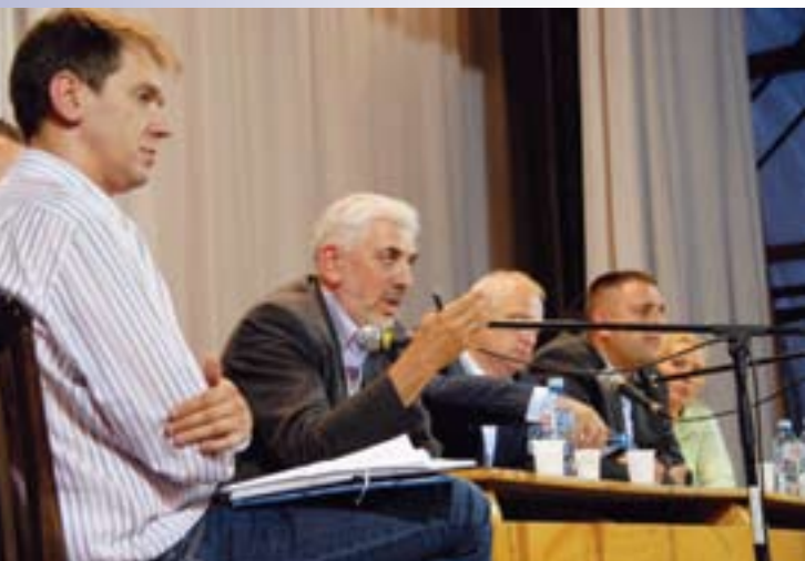
Трибина у МЗ Вранић о проблему наплате утрошене воде