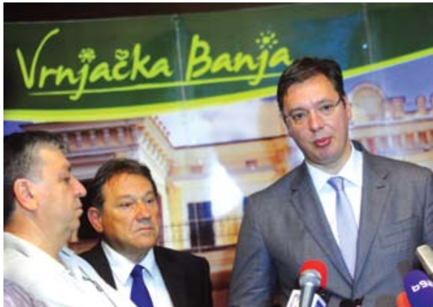
Премијер Вучић на свечаности поводом пуштања у рад обновљеног дела бањског парка са фонтаном

„Урадите све што је потребно да Бања привуче неупоредиво већи број туриста него данас!”