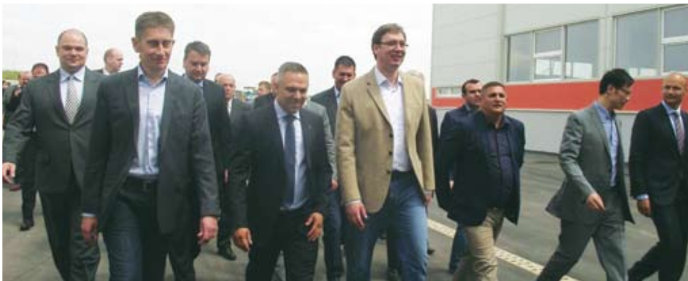
Премијер Вучић на отварању фабрике „Еверест“, која ће запослити, само у првој фази, 359 радника