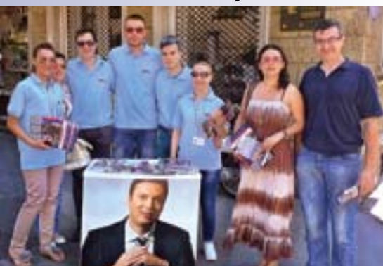
Подела „СНС Информатора“ у Земуну