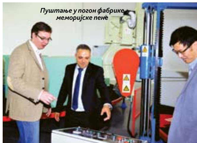
Пуштање у погон фабрике меморијске пене