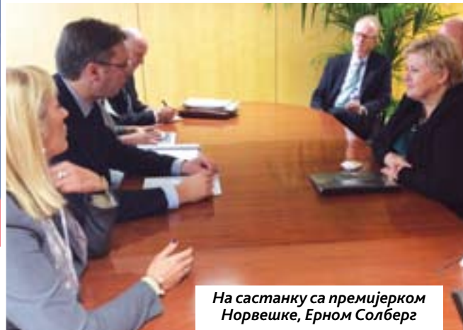
На састанку са премијерком Норвешке, Ерном Солберг