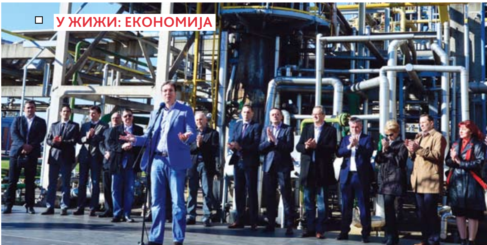
Председник Владе, Александар Вучић, у Метанолско-сирћетном комплексу у Кикинди