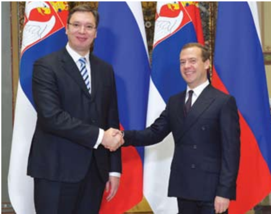
Срдчан сусрет: Александар Вучић и Дмитриј Медведев

Председник Владе Србије, Александар Вучић, предводио је државну делегацију Србије током тродневне званичне посете Руској Федерацији