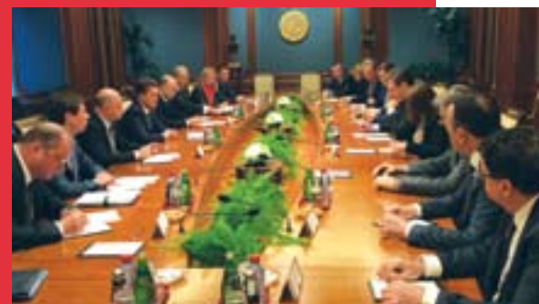
Договори са представницима Гаспрома

Премијер Вучић и Алексеј Милер, директор Гаспрома, разговарали су о сарадњи у области енергетике и гасном аранжману. Током састанка потписан је и споразум о проширењу капацитета складишта гаса Банатски двор. Премијер Вучић истакао је да складиште које ће моћи да прими милијарду кубних метара гаса, уместо досадашњих 460 милиона, представља додатни гарант енергетске стабилности и безбедности Србије. Нагласио и да Србија, после много година, без дана кашњења, измирује све текуће обавезе према Гаспрому, као и да од ове компаније, као једног од стратешких партнера Србије, очекује помоћ у одређивању висине цене гаса за српске фирме МСК и Азотара.