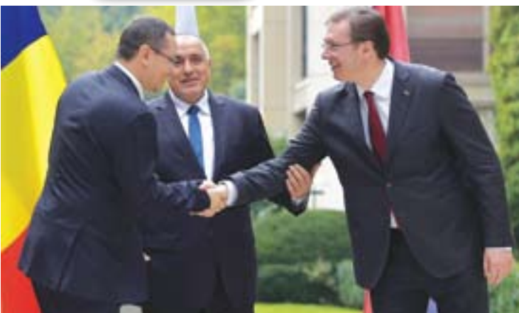
Премијери Понта, Борисов и Вучић