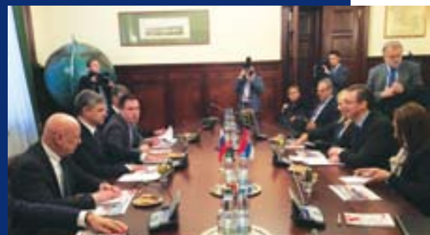
Састанак са челницима Руских државних железница