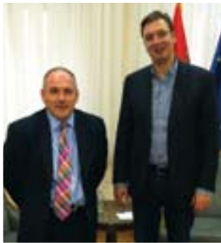
Халфон и Вучић