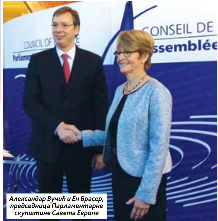
Александар Вучић и Ан Брасер, председница Парламентарне скупштине Савета Европе

„Стабилност региона значи стабилност целе Европе“, изјавила је Брасерова, похвалила реформе српске Владе и честитала премијеру Вучићу на борби против корупције.