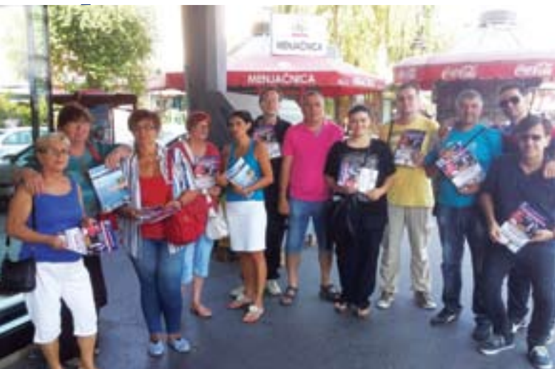
Активисти ОО СНС Земун у акцији поделе „СНС Информатора“ грађанима

У знак сећања на страдале суграђане, Јевреје који су 1942. године сточним вагонима депортовани у Јасеновац и Стару Градишку, положени су венци на меморијални споменик на Јеврејском гробљу у Земуну. У част погинулим српским борцима, на православној деоници Земунског гробља подигнут је крст са уклесаним именима и посветом "Палим борцима за ослобођење и уједињење 1914-1918. „Као и увек, подела новог броја „СНС Информатора“ и дружење СНС активиста са грађанима није изостало ни овог пута у Земуну.