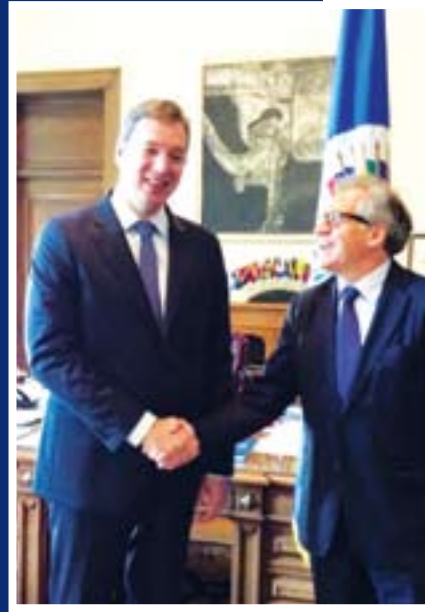
Разговор са Луисом Алмагром, секретаром Организације америчких држава

Генерални секретар Алмагро истакао је да Србија има велике пријатеље у земљама Северне и Латинске Америке и Кариба, и додао да је неопходно продубити те везе и ојачати контакте како би Организација америчких држава могла више да помогне Србији. „Морамо да нађемо потенцијална тржишта у нашим земљама која би за вас била занимљива“, истакао је генерални секретар Алмагро. Организација америчких држава окупља 34 земље Северне и Латинске Америке и Кариба, а Србија у тој организацији има статус посматрача.