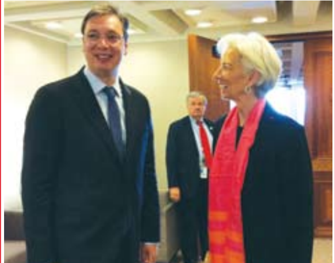
Александар Вучић и Кристин Лагард

Председник српске Владе, Александар Вучић, током посете САД-у, састао се у Вашингтону и са директорком Међународног монетарног фонда, Кристин Лагард, која је српском премијеру и Влади упутила речи подршке и охрабрења. Лагард је истакла да су резултати реформи бољи од очекиваног, али да је неопходно задржати унутрашњи притисак како би они били још бољи и како би опоравак српске економије био потпун. Премијер Вучић изјавио је да Србија мора да настави са реформама једнаком снагом и енергијом као и до сада, јер посао још није готов.