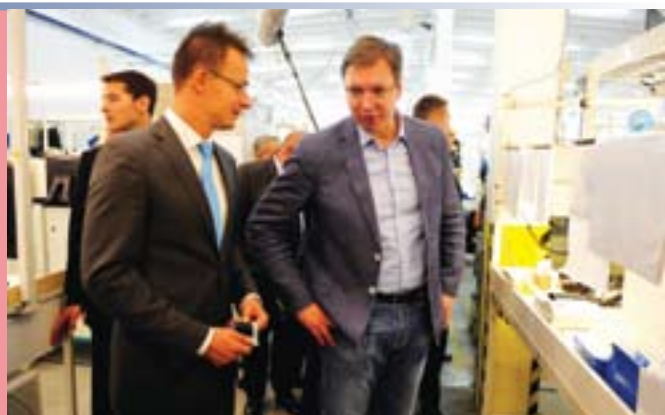
Премијер Вучић и Петер Сијарто, мађарски министар спољних послова

Фабрика је почела са пробним радом тачно пре годину дана, а у њој је тренутно 490 радника, од којих 310 стално запослених и 180 на обуци. Планира се да до маја следеће године фабрика има укупно 800, а до краја 2016. године чак 1.000 радника, што је веома значајно за мештане Сенте и околних насеља.