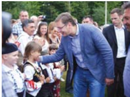
Посета премијера Вучића југу Србије