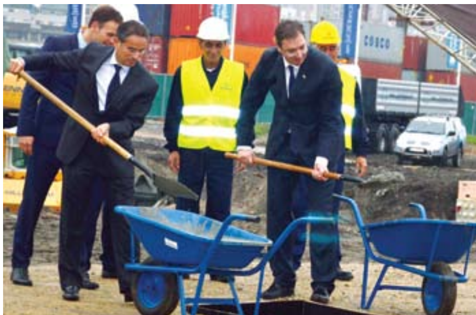
Премијер Вучић и Мухамед Алабар постављају камен темељац

ма који су од почетка веровали у овај пројекат и који се нису плашили критика, посебно шеику Мухамеду бин Заједу, представнику „Игл хилс“, Мухамеду Алабару, и градоначелнику Београда, Синиши Малом. Данас се поставља камен темељац за први, од два милиона квадрата, односно прва, од милион лопата које ће Београду дати нови простор за бољи живот. Од данас у Београду ниче нови град, а станове, куле и хотеле градиће српске фирме и радници. Пројекат који ће вредети 3,5 милијарди евра, упослиће на десетине хиљада људи. То више није сан и обећање, већ данас постаје стварност“, рекао је премијер Вучић.