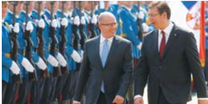
Дочек чешког премијера Соботке