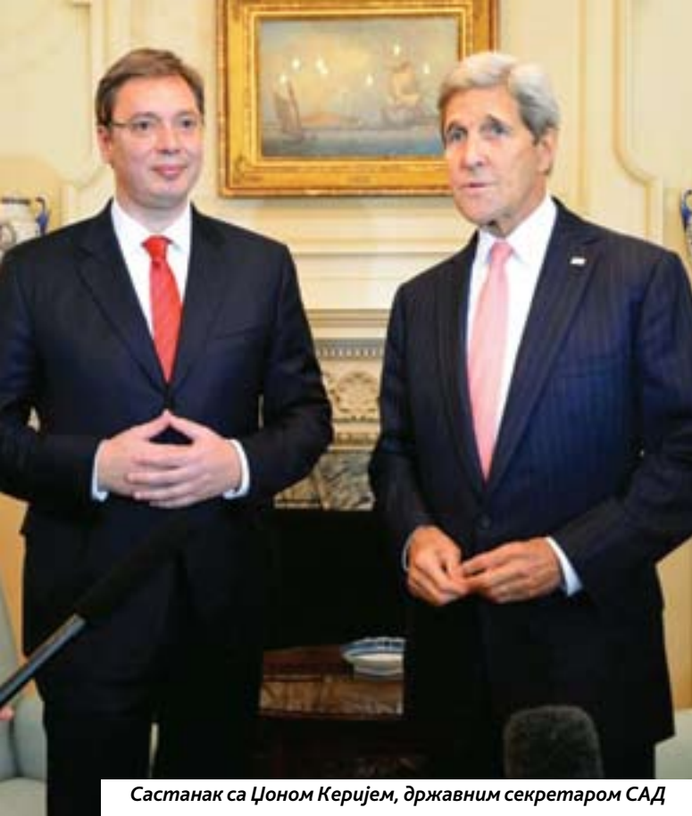
Састанак са Џоном Керијем, државним секретаром САД

Према речима премијера Вучића, углед Србије у САД-у данас је драматично већи, што је веома важно, јер се све више америчких инвеститора интересује за улагање у нашу земљу.