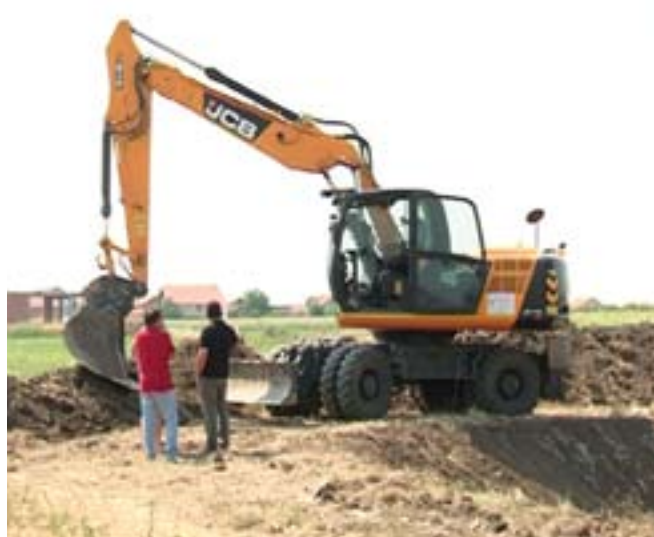
Радови на сваком кораку