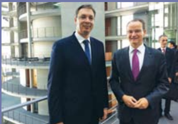
Са Гинтером Крихбаумом, председавајућим Одбора за ЕУ

Председавајући Одбора за ЕУ, Гинтер Крихбаум, истакао је да Одбор поштује лична залагања српског премијера у