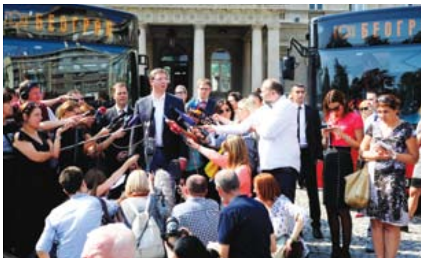
Свечана примопредаја нових аутобуса испред Скупштине Београда