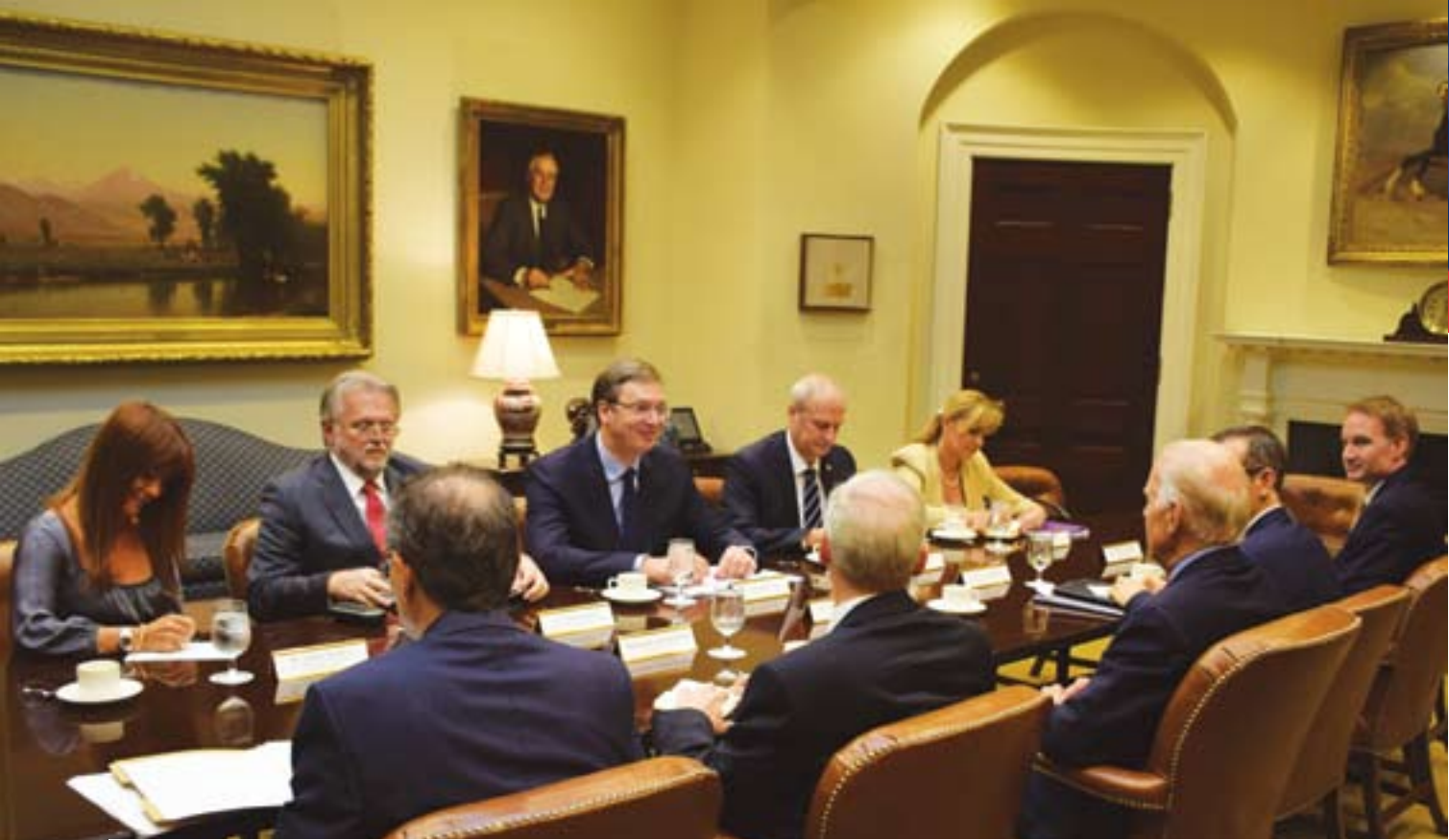
Премијер Александар Вучић и потпредседник Џозеф Бајден са сарадницима