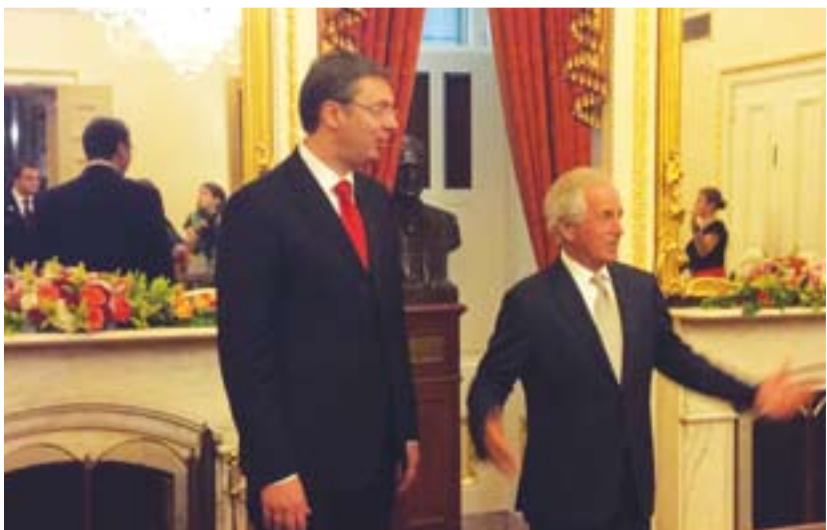
О европском путу Србије са конгресменом Бобом Коркером

Премијер Вучић састао се са конгресменом Крисом Смитом, председавајућим Хелсиншке комисије, и конгресменом Бобом Коркером, председавајућим Спољнополитичког одбора Сената, са којима је разговарао о европском путу Србије, регионалној сарадњи, економским реформама и мигрантској кризи.