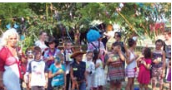
Ада - Мол

Након унутарстраначких избора у ОО СНС Свилајнац, формиран су савети који увелико израђују програме из својих области, од којих ће се формирати предизборни програм, усмерен на развој Општине и унапређење квалитета живота свих становника. Иначе, активисти СНС у Свилајнцу стално указују да актуелна власт, коју чине СДС и СПС, не ради у интересу грађана. Сваког дана omasовљавамо чланство, разговарамо са грађанима о проблемима, јачамо јединство у Странци и спремно чекамо изборе.