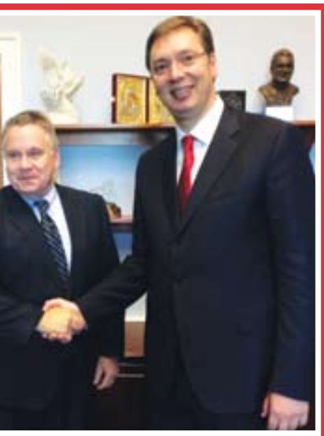
Са конгресменом Крисом Смитом, председавајућим Хелсиншке комисије

„Директорка Лагард похвалила је наш раст и поздравила економски курс српске Владе. ММФ поштује нашу одговорност. Разговарали смо о повећању плата и пензија, и заједнички закључак је да Србија несумњиво иде напред, што ће договор са ММФ-ом и показати. Очекујем још боље резултате у 2016. и 2017. години“, истакао је премијер Вучић.