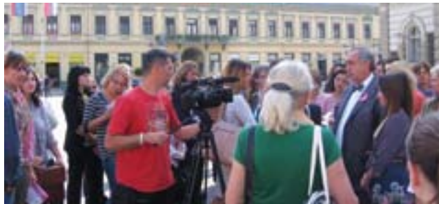
Форум жена СНС Градског одбора Нови Сад осмислио је низ активности са циљем да се подигне свест о опасности од карцинома и значају превенције и раног откривања болести

Ф орум жена Српске напредне странке Градског одбора Нови Сад обележио је месец октобар низом активности са циљем да се подигне свест људи о овој, све чешћој болести и да подстакне жене да предузму одговарајуће мере превенције и раног уочавања симптома.