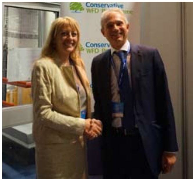
Састанак са британским министром за ЕУ, Дејвидом Лидингтоном

- За Србију је важно да спољнополитичка активност буде интензивна и да Србија гради своје позиције у Европи и свету. Важно је презентовати аргументацију Србије на њеном ЕУ путу, али и представити политичке и економске околности у нашој земљи и кораке које предузимамо у реформском процесу. Поготово, у овом тренутку, када постајемо они који нуде решења, који предлажу, који не чекају да се ствари дешавају, а ми само да реагујемо. Процес приступања Србије ЕУ, има веома важан утицај на цео реформски процес у земљи и његово спровођење одразиће се и на побољшање амбијента за пословање и инвестирање. Приступни преговори, са једне стране, осигуравају структурне капацитете Србије на пољу економског раста, а са друге стране стабилност инвестиција. Приближавање стандардима ЕУ, пре свега, обезбеђује економску транспарентност, на коју се данас, када је економија у питању, гледа као на кључни критеријум где уложити своје инвестиције. Економске мере Владе, које ће бити спроведене, дају, такође, и конкурентну страну српској економији, када је у питању регион Западног Балкана.