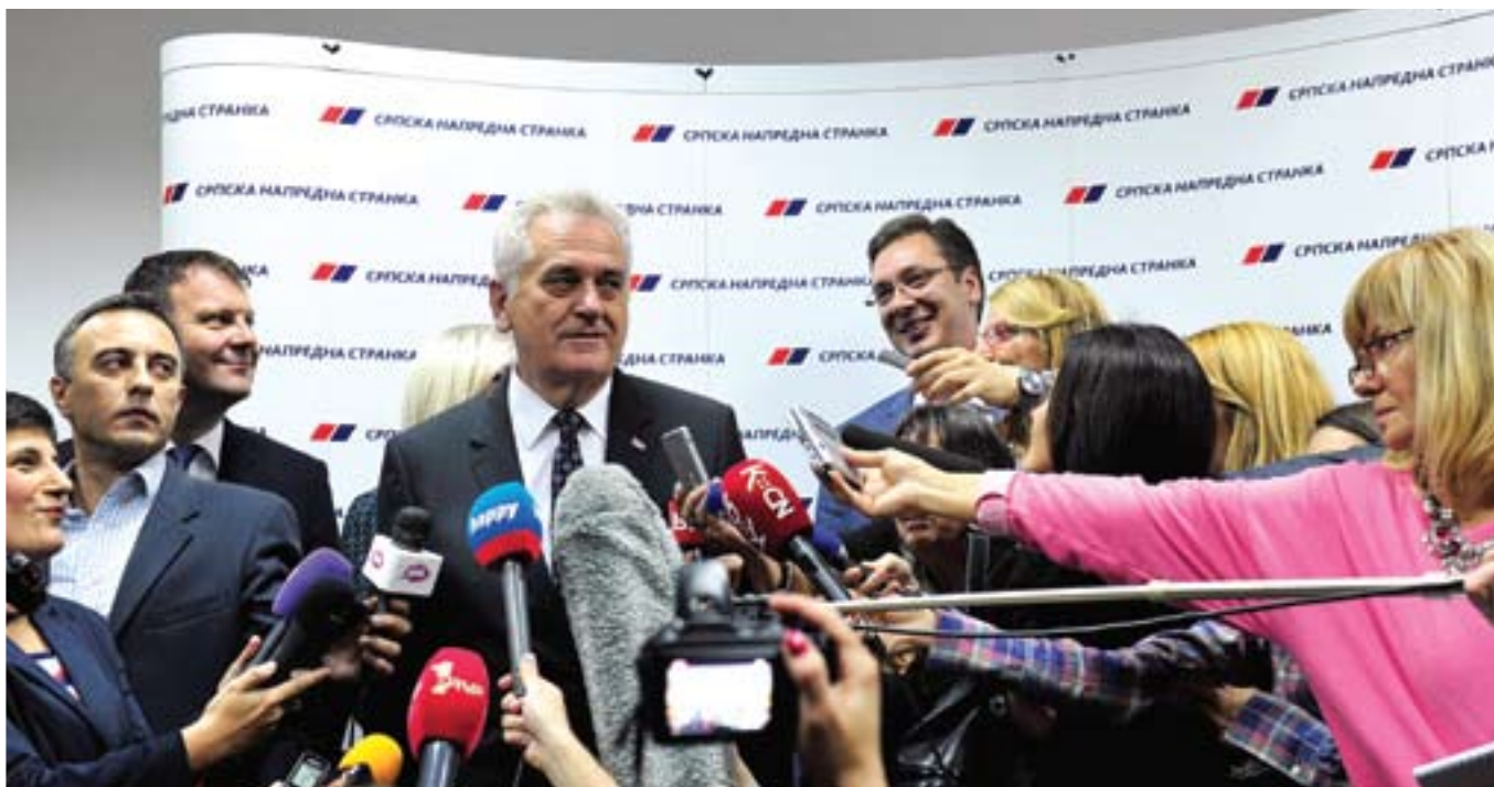
Драги гост на рођендану СНС био је Томислав Николић