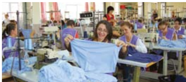
Најуспешнији извозник у Златиборском округу: Погон „Санатекса“ у Новој Вароши