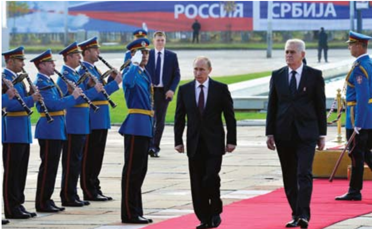
Највише државне почести: Свечани дочек руског председника испред Палате „Србија“

Председник Србије, Томислав Николић, дочекао је председника Руске Федерације, Владимира Владимировича Путина, на аеродрому „Никола Тесла“, а затим га је, уз највише државне почести, угостио у Палати „Србија“. Председник Николић поручио је, у разговору са председником Путином, да Србија у Русији види искреног и великог пријатеља, и да је помоћ те земље драгоцену и очувању територијалног суверенитета и интегритета Србије, посебно када је у питању Косово и Метохија.