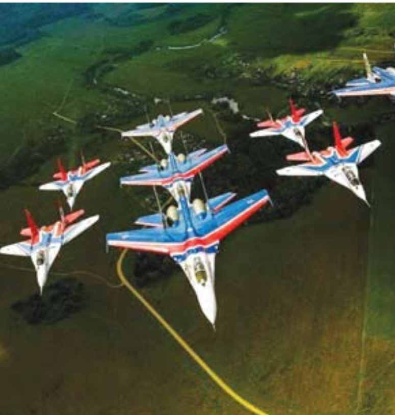
Спектакл су увеличали пилоти руске летачке групе „Стрижи“, као и падобранци Војске Србије, који су извели падобрански десант код споменика „Вечна ватра“