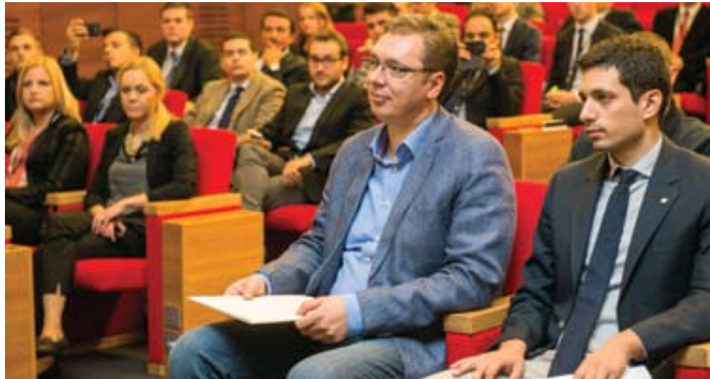
Александар Вучић и Константинос Киранакис