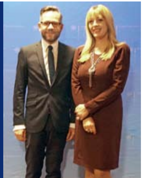
Министарка Јоксимовић са Михаелом Ротом, немачким министром за ЕУ