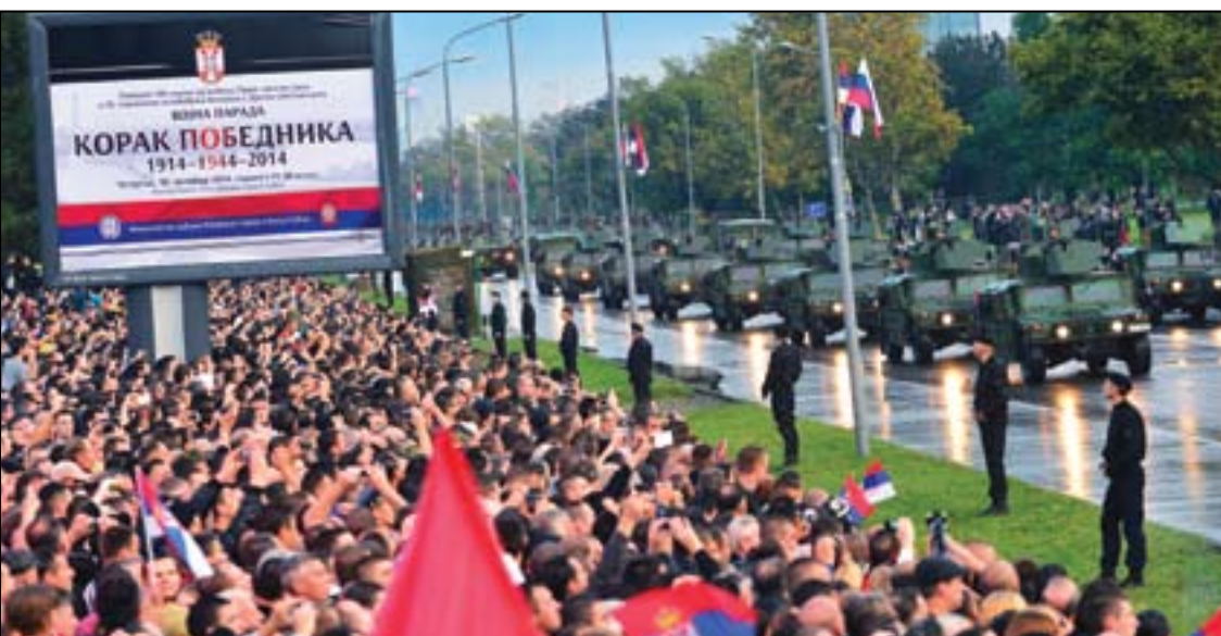
Моторизовани ешалон састојао се од 14 подешалона борбених система, и војних и борбених возила - тенкова, возила специјалне намене за извиђање и за везу, артиљеријских оруђа...