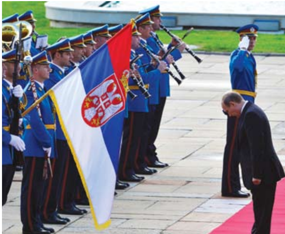
Председник Владимир Путин одаје почит српској застави