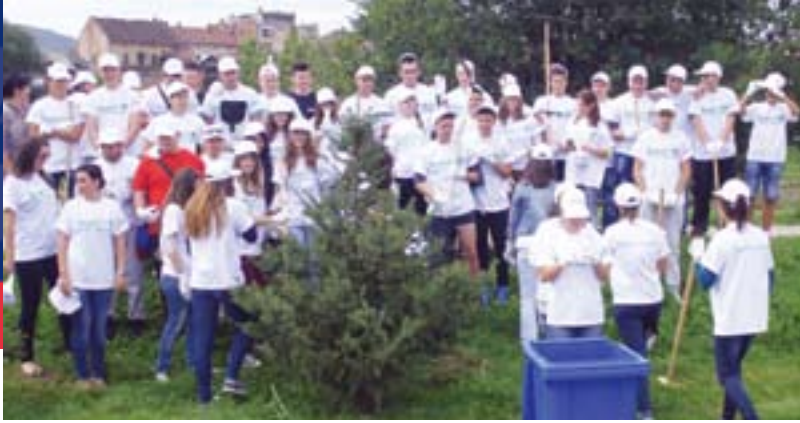
Волонтери Канцеларије за младе у Власотинцу чисте делове града поред реке Власине

ОО и постављања повереника, наставља са састанцима и разговорима са чланством по мањим групама, да би се остварило што бољи контакт са људима, и боље и брже решавали проблеми.