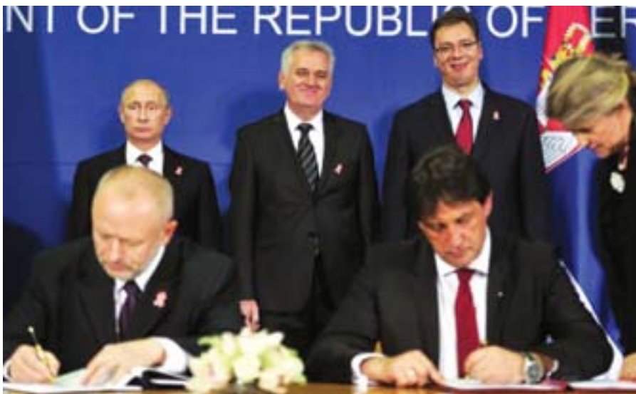
Свечано потписивање Војно-техничког споразума између Србије и Русије

- Сигуран сам да смо на паради сви били поносни. Још једном смо показали народу да нема разлога за бригу, јер их чува јака војска. Приказали смо способност Војске Србије за извршавање задатака из све три мисије које су јој поверене, а то су одбрана земље, учешће у мултинационалним операцијама и пружање помоћи становништву у ванредним ситуацијама. Ово је била година у којој су наши грађани били изложени поплавама, у којима су били угрожени њихови животи и имовина. Припадници Војске Србије даноноћно су помагали и даље помажу угроженима, и ово је била прилика да се нашим грађанима прикажемо у пуном сјају, у знак захвалности за поверење које нам указују.