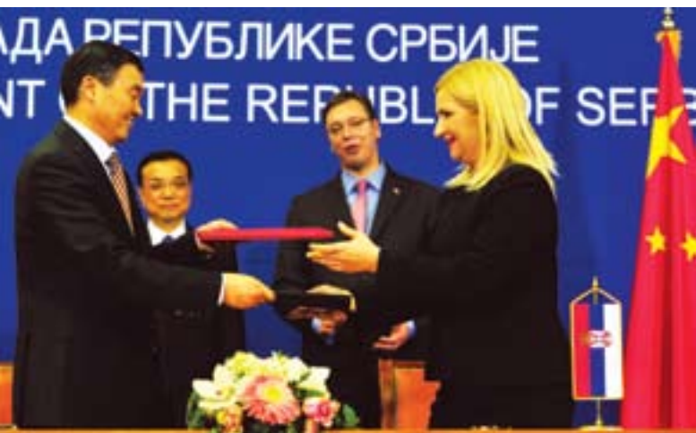
Србија и Кина потписале су 13 докумената о сарадњи

структуре, саобраћаја, енергетике и туризма. Договорена је изградња пруге Будимпешта-Београд, која би касније требало да се прошири и до Македоније и Грчке, што су одличне вести за Србију. Разговарали смо и о другим пројектима, ТЕ „Костолац“, изградњи индустријске зоне, лука, саобраћајних чворишта, довођењу кинеских компанија... Веома сам поносан што се Србија показала као добар и успешан организатор Самита. Захваљујем се кинеском премијеру, Лију Кеђијангу, што је Србији учинио част да буде коорганизатор скупа. Уверен сам да ће сарадња са Кином, и кроз механизам 1+16, донети много тога доброг земљама у региону и грађанима. Захваљујем се и свим