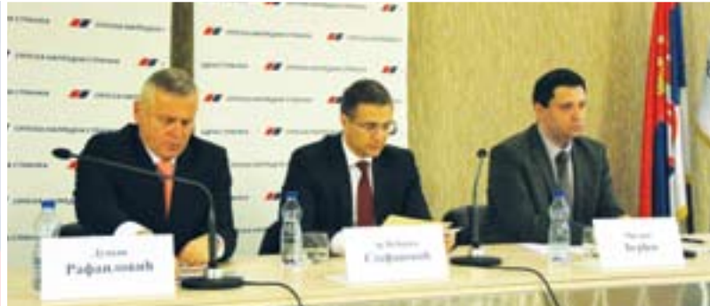
Небојша Стефановић на трибини ГО СНС Београд