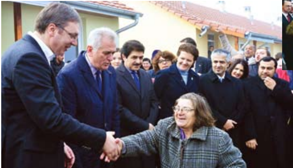
Председник Томислав Николић и премијер Александар Вучић са грађанима Обреновца који су добили нове куће

„Велика је штета што је Србију задесила поплава, али је након тога утврђено колико и на кога можемо да рачунамо. Надам се да ће ова деца стоструко вратити уложено и да ће постати добри, паметни, школовани људи, који ће служити Србији на част“, рекао је председник Николић.